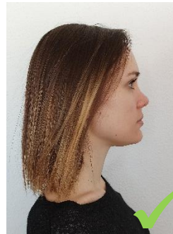
Les cheveux sont en arrière pour dégager le visage, les muscles sont détendus, le regard est porté au loin