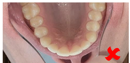
Cadrage coupé derrière