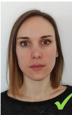
Le visage est dégagé et détendu