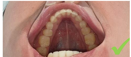
Arcade du bas

Tout au long de cette procédure, il est important de respirer uniquement avec le nez afin de ne pas faire de buée sur les miroirs .