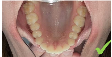
Arcade du haut

patient(e) vient écarter la lèvre opposée au miroir afin de dégager toutes les dents antérieures. Plus la bouche sera ouverte, meilleur sera le cliché.