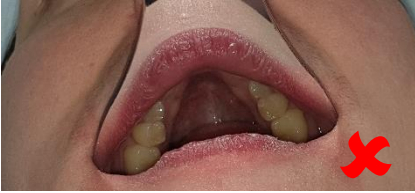
Lèvre recouvrant les dents