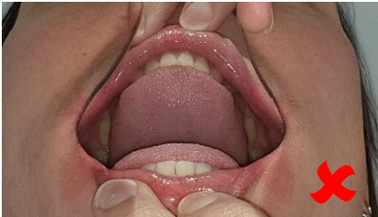
Langue recouvrant les dents