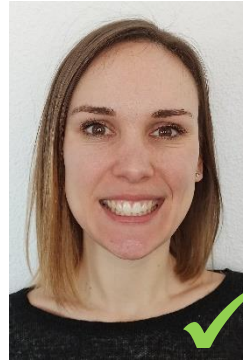
Le sourire découvre les dents